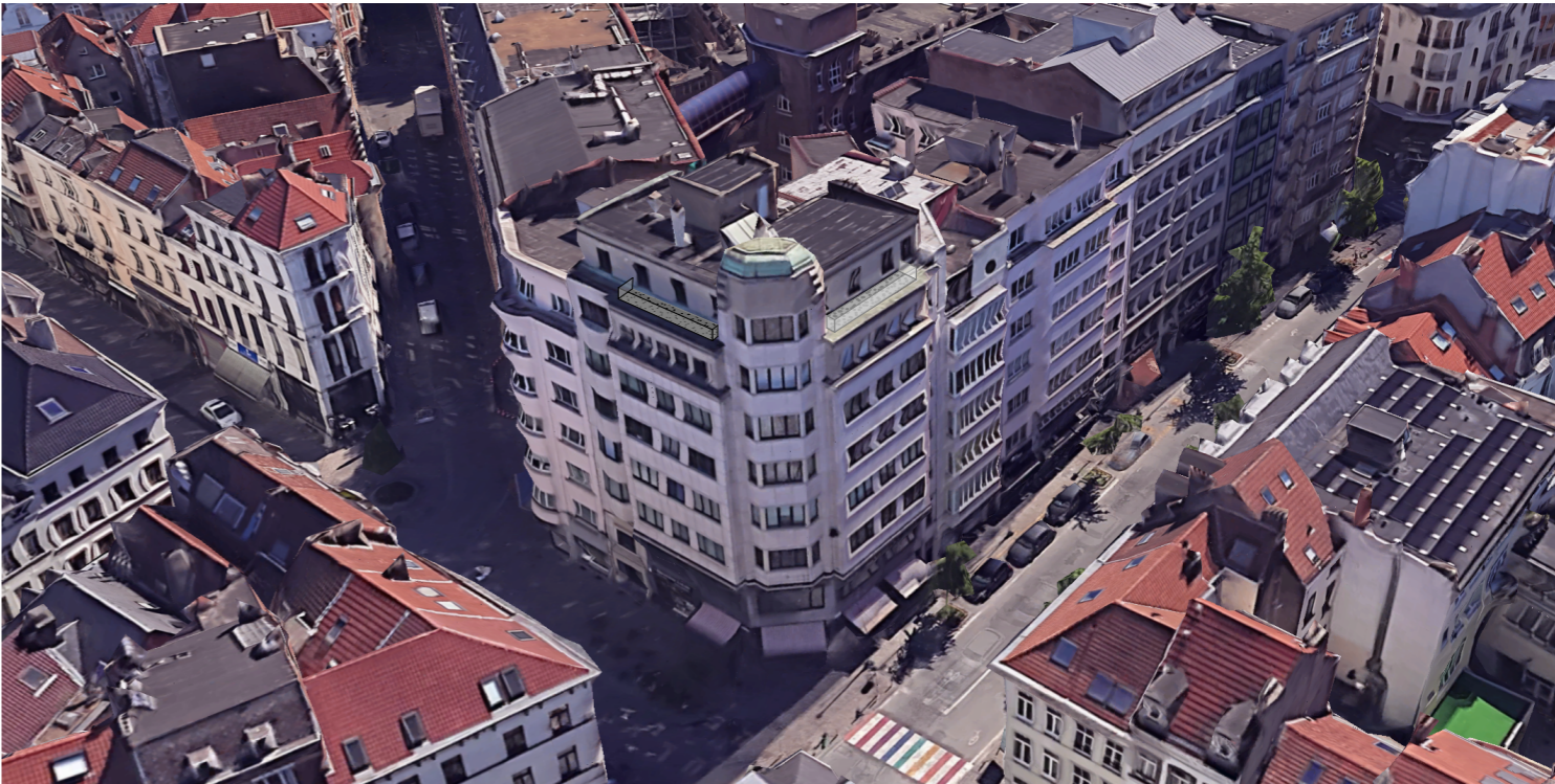
Vue aérienne - simulation situation projetée