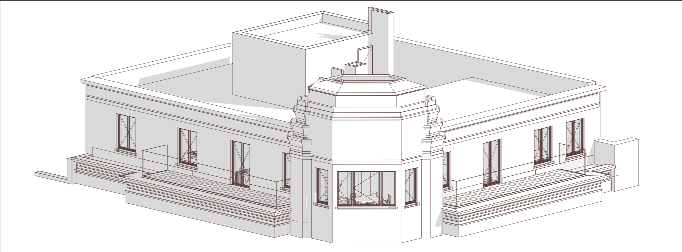
Axonometry situation projetée