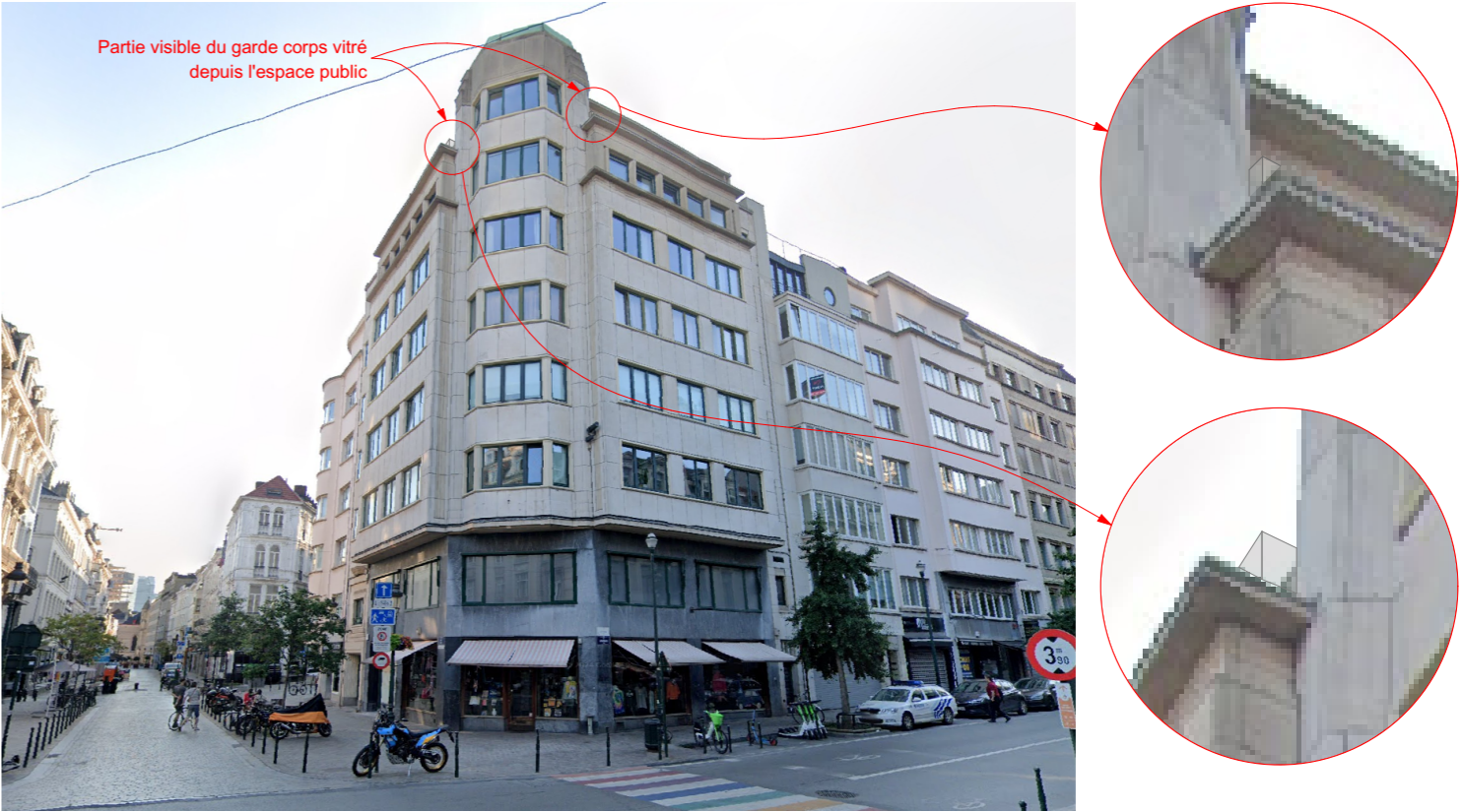
Vue depuis la voirie - simulation situation projetée