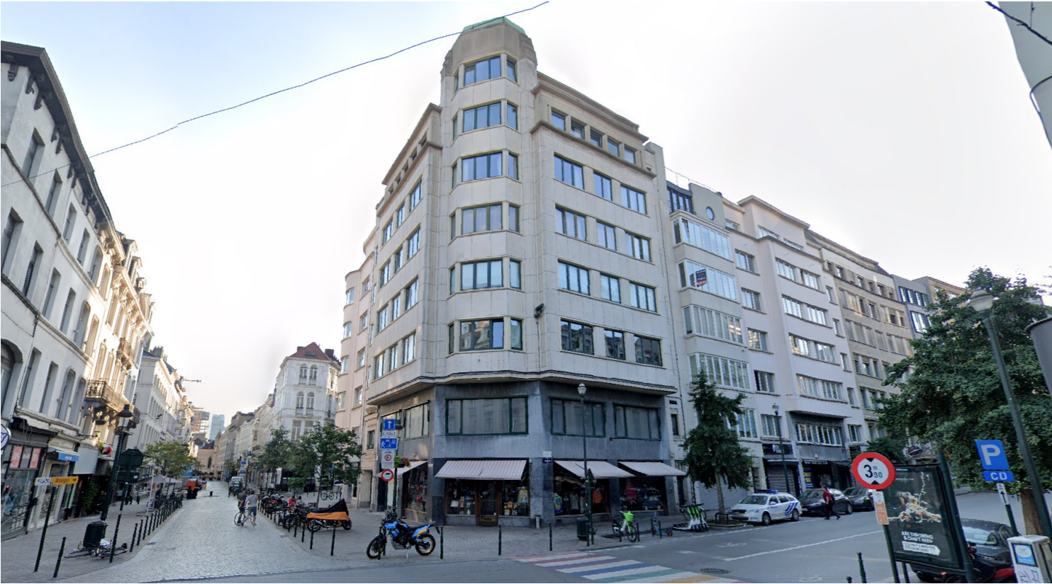
Vue depuis la voirie - situation existante